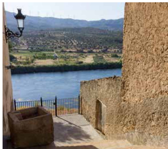
NOVES VISTES DES DEL MIRADOR DE DALT.

També s'ha arranjat la plaça del Forn, de 575 metres quadrats, que s'ha enrajolat seguint la mateixa línia urbanística prevista per la resta del barri històric del poble. Així, aquesta plaça es consolida com gran espai diàfan que servirà per acollir esdeveniments culturals i actes festius al Nucli Antic.