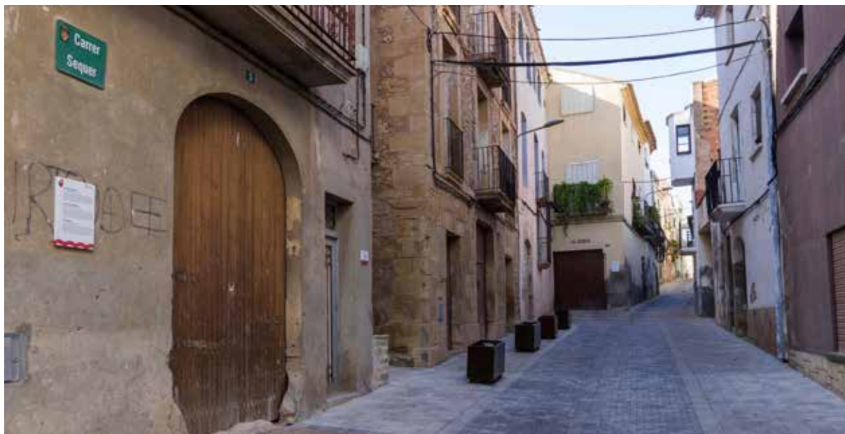
NOU ASPECTE QUE PRESENTA EL CARRER SEQUER DESPRÉS DE LES OBRES DE MILLORA REALITZADES.

El Nucli Antic de Riba-roja d'Ebre ofereix, des de fa unes setmanes, una imatge renovada. Tot plegat, és fruit de les actuacions dutes a terme per tal de recuperar aquesta zona del municipi. Així, al carrer Sequer s'ha renovat totalment el sistema de xarxa de sanejament, incloses les escomeses i la recollida d'aigües pluvials en embornals. A més, s'ha substituït la xarxa de clavegueram, s'ha renovat la xarxa d'aigua potable i s'ha pavimentat la via amb lloses antilliscants a les voreres, properes a les façanes, i amb llambordins prefabricats a la conca central del carrer. Tota la via, doncs, ha quedat a la mateixa alçada, facilitant el pas dels vianants a aquesta zona antiga del poble.