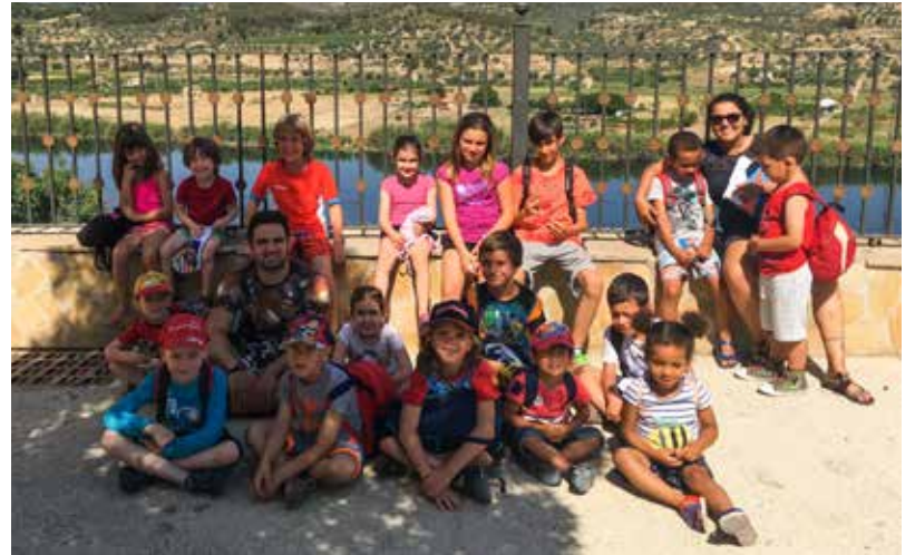
ELS NENS DEL PRIMER TORN, GAUDINT DE LES ACTIVITATS DEL CASAL.

L'Àrea de Joventut, Esports i Educació de l'Ajuntament de Riba-roja ha organitzat una nova edició del Casal d'Estiu per a nens i nenes de 3 a 14 anys. S'han programat tres torns: del 27 de juny al 8 de juliol, de l'11 al 22 de juliol, i del 25 de juliol al 5 d'agost. L'horari, de dilluns a divendres, es reparteix en tres franges: matí, tarda i nit. Les activitats s'adapten a l'edat de tots els infants: esports, jocs tradicionals i de psicomotricitat, activitats d'aigua i jocs de piscina, tallers, manualitats, activitats didàctiques de reforç, zumba, balls, gimcana i jocs nocturns.