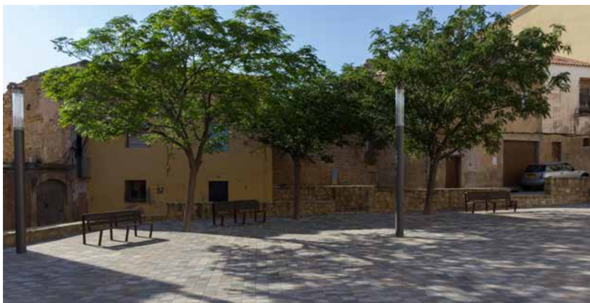
LA PLAÇA DEL FORN TAMBÉ S'HA RENOVAT AMB LA MATEIXA RAJOLA QUE S'HA COL·LOCAT AL CARRER SEQUER.

Aquesta actuació s'emmarca en el pla de reforma integral del Nucli Antic, i és la primera gran intervenció que s'hi fa des dels anys 80. En aquest sentit, cal destacar que la inauguració anirà a càrrec del president de la Generalitat, Carles Puigdemont, que visitarà el municipi el dissabte 16 de juliol.