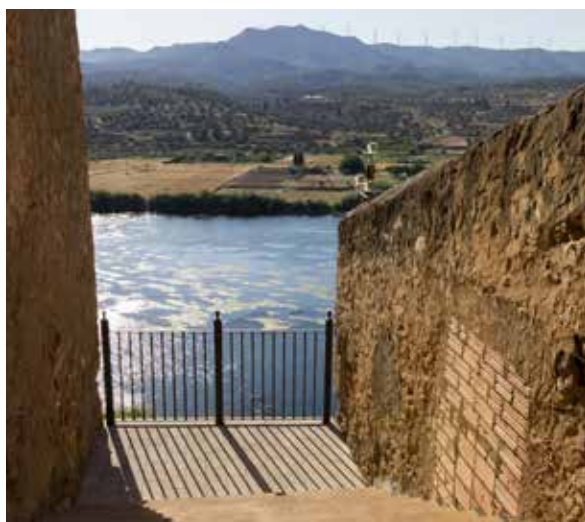
IMATGE DEL RIU EBRE DES DEL MIRADOR DE BAIX.

Pena i al de Jesús Moncada, situat al final del mateix carrer Sequer. Aquests espais, fins ara tapiats, permeten gaudir d'unes noves vistes d'un dels atractius principals de Riba-roja: la façana fluvial.