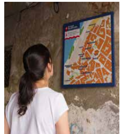
UN DELS NOUS PLÀNOLS TURÍSTICS, AL CARRER PORTAL.

nous miradors que hi ha sobre el riu Ebre, anomenats Mirador de Dalt i Mirador de Baix. Així mateix, s'ha editat nova documentació turística amb dades actualitzades, tenint en compte els camins asfaltats del Meandre i de Senals, amb propostes de rutes de senderisme o bicicleta. Es distribuirà a la Casa de la Vila i establiments locals, així com en fires i indrets de referència de la comarca, com l'oficina comarcal de Turisme de Miravet o la reserva natural de Sebes a Flix.