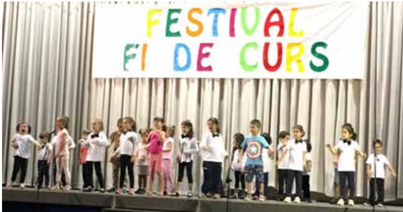
LA FESTA DE FINAL DE CURS DE L'ESCOLA ES VA FER A LA SOCIETAT.

Els alumnes dels centres educatius de Riba-roja d'Ebre han acabat les classes aquest mes de juny amb festes i festivals de final de curs. Els nens i nenes de l'escola Sant Agustí ho van fer el divendres 17 de juny, mentre que els de la llar d'infants Els Figotets van fer una festa el dia 22. A Sant Agustí, el curs que ve hi estudiaran 74 alumnes, els