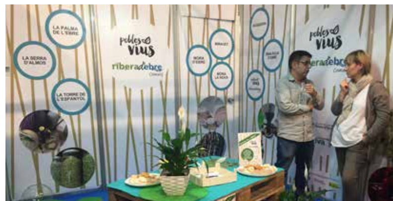
POBLES VIUS, LA NOVA MARCA COMERCIAL DE LA RIBERA D'EBRE, ES VA PRESENTAR A LA FIRA MULTISECTORIAL DE MÓRA A L'OCTUBRE.

En la mateixa línia, des de Riba-roja s'està treballant per reactivar la Unió de Comerciants, una entitat que ja va existir i que ara es vol tornar a tirar endavant. De moment és un projecte i encara cal concretar com funcionarà, incloent-hi també empreses