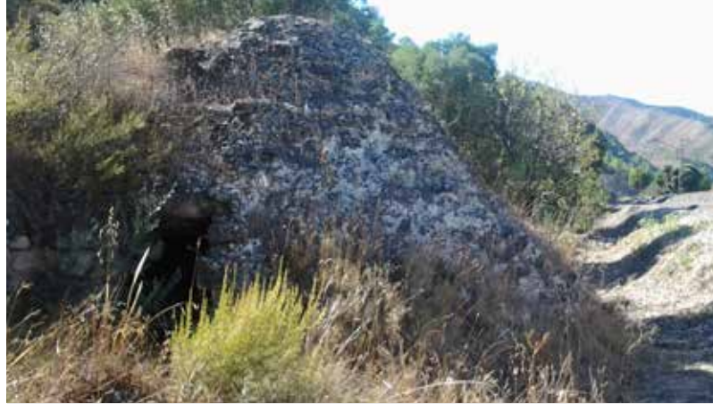
IMATGE DEL POU DE GEL QUE S'HA LOCALITZAT AL TERME MUNICIPAL.

L'entitat Amics de Riba-roja és la que ha treballat durant molt de temps per tal de localitzar i inventariar aquestes estructures, amb el suport del Consistori. El seu objectiu és contribuir a la seva restauració, conservació i valorització com a actiu visitable.