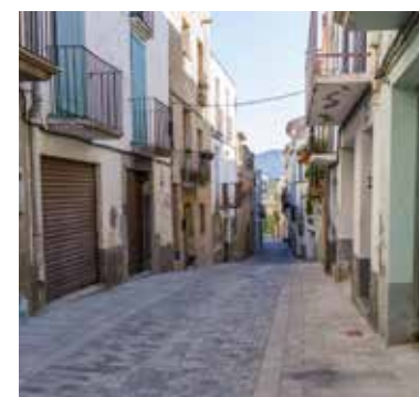
L'OBJECTIU ÉS MILLORAR LA IMATGE DEL CASC HISTÒRIC.

equivalent a l'import de la quota de l'Impost sobre Construccions, Instal·lacions i Obres (ICIO), meritat en la pintura de les façanes i de la taxa d'expedició de llicència urbanística corresponent. Els que s'acullin a la mesura podran triar entre realitzar els treballs de pintura personalment, demanar-ho a un tercer o que els dugui a terme la brigada de l'Ajuntament.