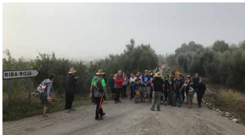
UN GRUP DE VEÏNS DE LA COMARCA VAN GAUDIR EL 16 D'OCTUBRE D'UNA CAMINADA PEL TRAM DEL GR-99 ENTRE RIBA-ROJA I FLIX.

D'una banda, empresaris del sector turístic i tècnics municipals, i de l'altra, veïns de la comarca, han participat en diferents caminades per aquest camí natural per conèixer a fons què ofereix des de diversos punts de vista: la història de la navegabilitat de l'Ebre, la fauna i flora, l'impacte de la construcció de les preses del segle