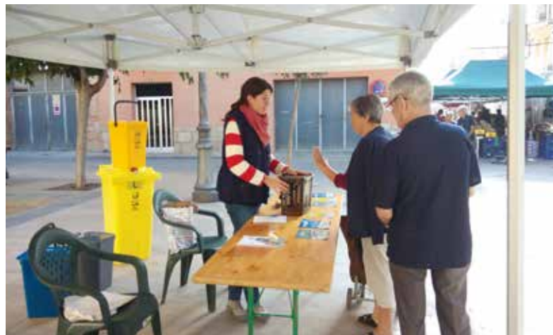
UNA DE LES CARPES INFORMATIVES INSTAL·LADA PER INFORMAR ELS VEÏNS DEL NOU SISTEMA DE RECOLLIDA PORTA A PORTA.

recull el rebuig i els bolquers. Les restes d'orgànica es recullen els dimecres, divendres i diumenges. Els envasos, dimecres i divendres. El paper i cartó, divendres. I a més de dilluns, els dimecres, divendres i diumenges també es podran treure a la porta els bolquers. Dimarts, dijous i dissabtes no hi ha servei de recollida. Coincidint amb l'inici del porta a porta es va fer una xerrada i es van instal·lar carpes informatives per explicar el seu funcionament, i educadors ambientals van visitar alguns domicilis per tal que tothom tingués clar com havia d'actuar. Amb tot plegat s'ha aconseguit reduir el rebuig, que era l'objectiu principal del nou sistema, ja que d'aquesta manera es podran evitar les repercussions econòmiques que suposarà l'increment del cànon per disposar la brossa a un abocador (un 146% més de cara a l'any 2020). En cas contrari, l'Ajuntament es veuria obligat a pujar la taxa d'escombraries.