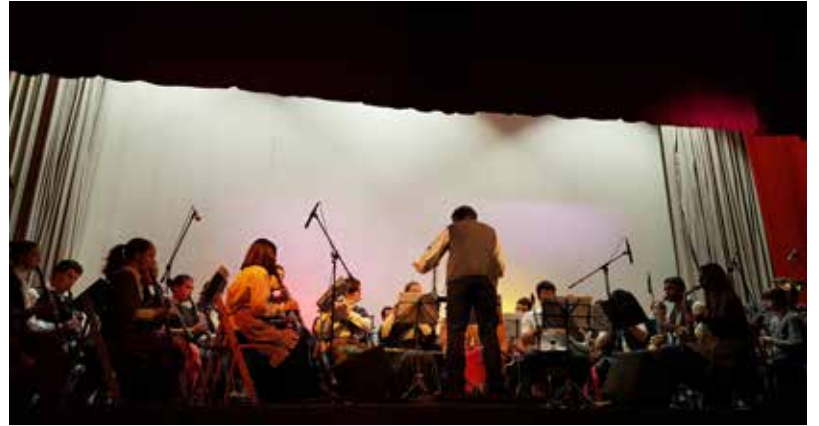
LA BANDA MUNICIPAL DE MÚSICA DE BENISSANET DURANT LA SEVA ACTUACIÓ AL VIIÈ COPA DE LLETRES.

Aquesta banda sonora es va interpretar per primera vegada a la Cota 705, un indret simbòlic de la batalla, i de la qual també s'ha enregistrat un disc gravat a l'església del Poble Vell de Corbera d'Ebre. La intenció és que aquestes peces "esdevinguin patrimoni del territori" i serveixin per mantenir viva la memòria de la Guerra Civil.