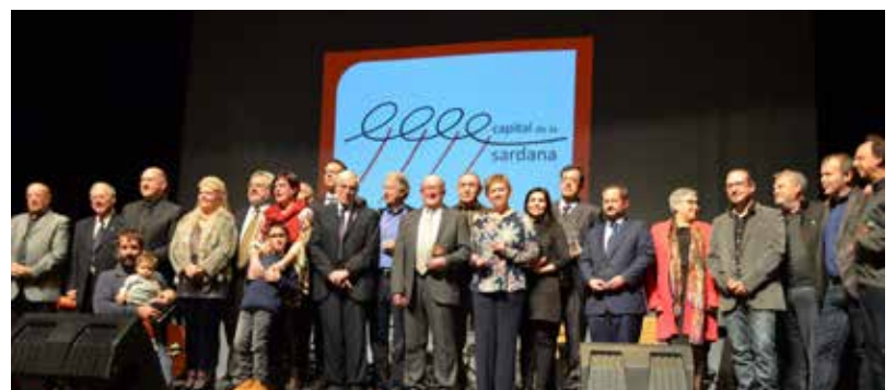
FOTOGRAFIA DE LA FAMÍLIA DE TOTS ELS GUARDONATS DELS PREMIS CAPITAL DE LA SARDANA 2016 AL TEATRE DE MOLLERUSSA.