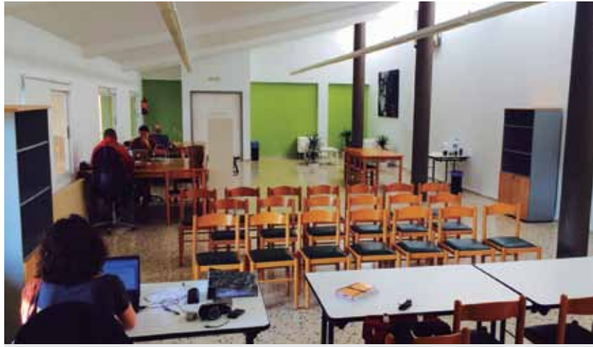
DIVERSOS PROFESSIONALS JA UTILITZEN LA ZONA LÍQUIDA PER TREBALLAR DURANT LA SEVA JORNADA LABORAL

Els interessats en el servei de Zona Líquida poden informar-se'n enviant un correu electrònic a aj.riba-roja@altanet.org