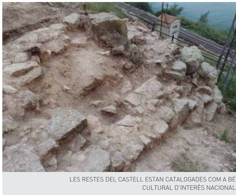
LES RESTES DEL CASTELL ESTAN CATALOGADES COM A BÉ CULTURAL D'INTERÈS NACIONAL

Total de les inversions: 1.360.560,24 €, dels quals 394.438 € provenen de subvencions i 813.446,52 €, del crèdit.