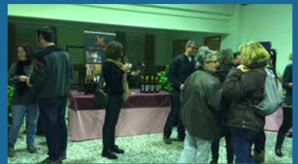
TERTÚLIA LITERÀRIA I VI, AL COPA DE LLETRES.