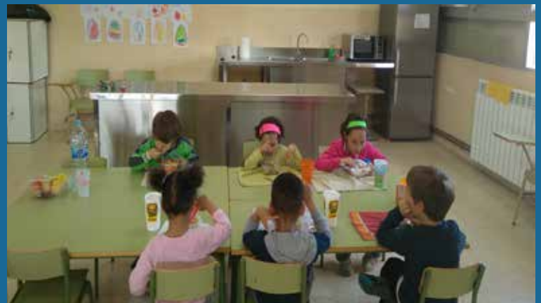
LES OBRES DEL MENJADOR I ELS RADIADORS DE L'ESCOLA ES VAN AVANÇAR A L'ESTIU A CÀRREC DEL PRESSUPOST 2016 PER PODER POSAR EN MARXA ELS SERVEIS A L'INICI DEL CURS.

electrodomèstics, entre ells els que han permès posar en marxa aquest curs escolar el menjador de l'escola Sant Agustí, un nou servei que ha arrancat amb sis usuaris fixos per donar resposta a la necessitat de conciliar l'horari dels nens amb els compromisos laborals de les famílies. Les obres dels carrers es van finançar amb un crèdit destinat íntegrament a inversions, sense que això però hagi suposat un major nivell d'endeutament a acabar l'any.