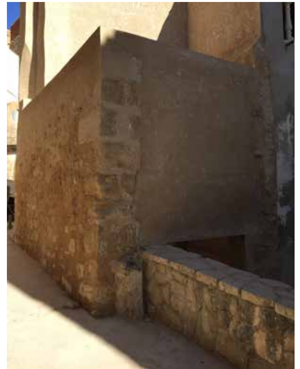
EL PERXI DE CAL NUNCI, RESTAURAT, CONSERVA UNA TÍPICA PARET DE MAÇONERIA.

Per a l'Ajuntament, les actuacions al Nucli Antic són estratègiques i claus per al futur desenvolupament turístic i econòmic, i s'han anat succeint en la mesura de la disponibilitat de recursos municipals. Així, s'ha millorat l'enllumenat, s'han instal·lat papereres i jardineres, s'han protegit els elements del patrimoni arquitectònic local amb una Ordenança i s'estan recuperant d'altres, com en el cas del Perxi de Cal Nunci.