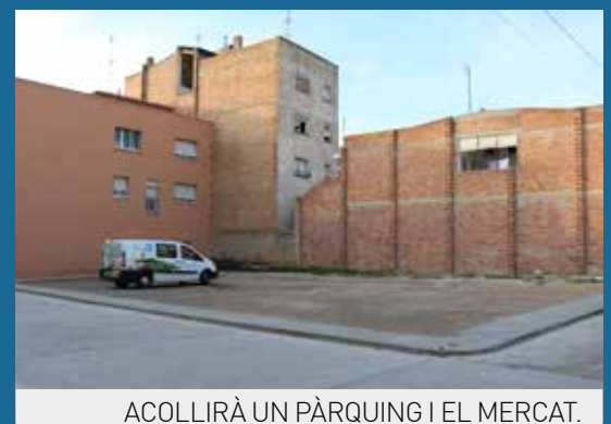
ACOLLIRÀ UN PÀRQUING I EL MERCAT.

L'Ajuntament ha adquirit el solar de ca Hilarion, situat al número 8 del carrer Fatarella, que roman sense urbanitzar. L'objectiu és condicionar la parcel·la i habilitar-la per situar-hi un pàrquing públic. L'espai s'urbanitzarà, s'hi instal·laran jardineres i servirà a més per reubicar-hi el mercat municipal, amb els paradistes ambulants que fins ara ocupen els carrers Sant Bartomeu i Fatarella. També s'encarregarà un mural a un artista local. La compra es finança amb càrrec al pressupost municipal d'aquest any i del 2017, en total 44.000 euros.