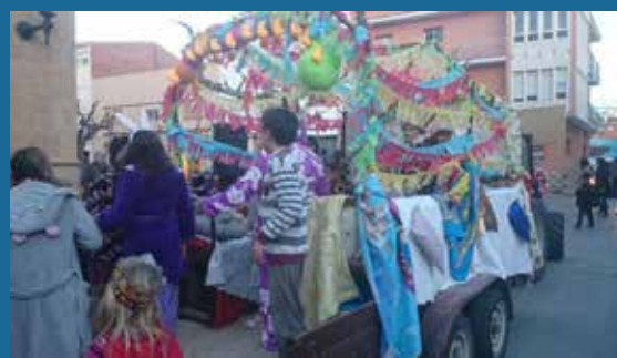
IMATGE DE LA FESTA DE CARNAVAL AL POBLE.