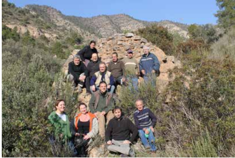
L'ENTITAT AMICS DE RIBA-ROJA, CREADA FA TRES ANYS, HA LOCALITZAT AQUEST PATRIMONI UBICAT PER TOT EL TERME.

Més informació: www.amicsderibaroja.cat/