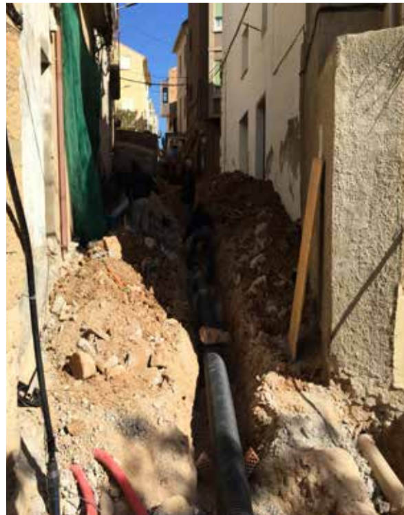
LA RENOVACIÓ DE LA XARXA DE SERVEIS HA SUPOSAT AIXECAR TOT EL CARRER SEQUER.

Aquest hivern s'ha completat la renovació dels serveis del carrer Sequer, on els veïns ja disposen d'una nova xarxa de sanejament, clavegueram i aigua potable, totalment renovada, per posar fi als problemes que l'antiga infraestructura dels anys 60 provocava als baixos de les cases. El proper pas és pavimentar el carrer amb lloses antilliscants i llambordins per anivellar tota la via, facilitant el pas dels vianants a la zona antiga del poble. I és que la nova imatge del carrer Sequer s'estendrà a mesura que més carrers històrics es vagin remodelant, fins a completar tot el projecte de reforma integral del Nucli Antic que la crisi econòmica va obligar a posposar. A més d'aquest carrer, s'està ja tirant endavant la remodelació de la plaça del Forn, en la mateixa línia urbanística, consolidant aquest espai diàfan per acollir actes culturals i festius al barri històric del poble.