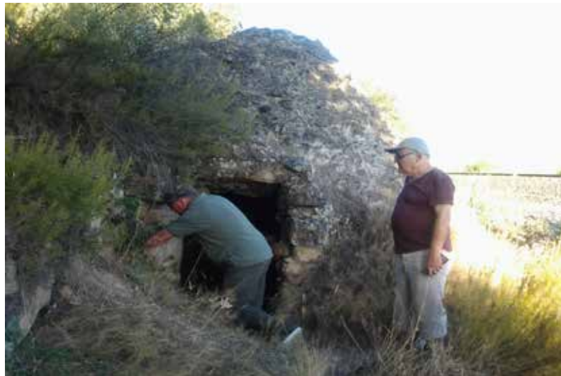
EL POU DE GEL LOCALITZAT, A 3 QUILÒMETRES DEL POBLE, S'UTILITZAVA PER CONSERVAR ALIMENTS I PER A ÚS MEDICINAL.