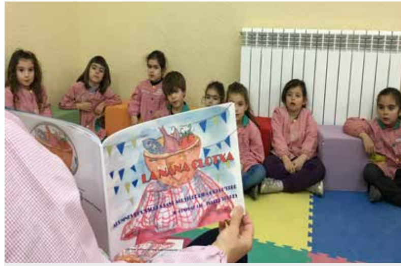
EL CONTE ES FARÀ ARRIBAR A TOTES LES ESCOLES DE LA COMARCA.