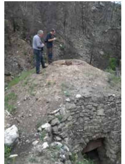
EN ELS FORNS ES FEIA LA DESTIL·LACIÓ SECA DE LA FUSTA.