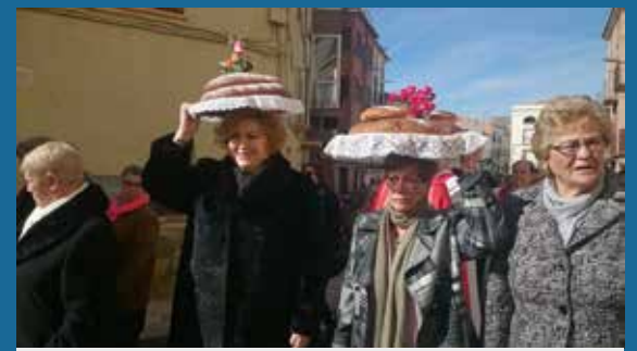
LA TRADICIONAL PROCESSÓ AMB LES COQUES.