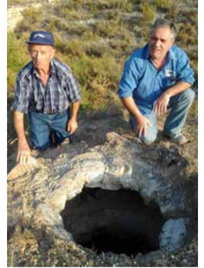
L'OBERTURA SUPERIOR SERVIA PER CARREGAR LES SOQUES.