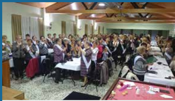
LES DONES EN EL BERENAR DE SANTA AGDA.

Nadal i l'arribada dels Reis Mags i el Pare Noel, la cursa de sant Silvestre, Cap d'Any, Sant Antoni, el Carnaval, Santa Madrona i el Copa de Lletres.