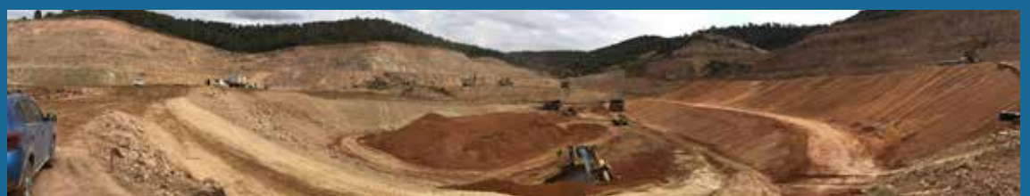
IMATGE DE LES OBRES DE CONSTRUCCIÓ DEL VAS DEL DIPÒSIT A LA PARTIDA DE LES VALLS.

ne la concessió. Com en tots els projectes de regadiu que s'impulsen al país, la Generalitat en subvencionaria el 85% de l'import de les obres, mentre que el 15% restant va a càrrec dels propietaris, i en aquest cas ho pagaria l'empresa. Aquest és el segon intent d'impulsar regadiu al terme.