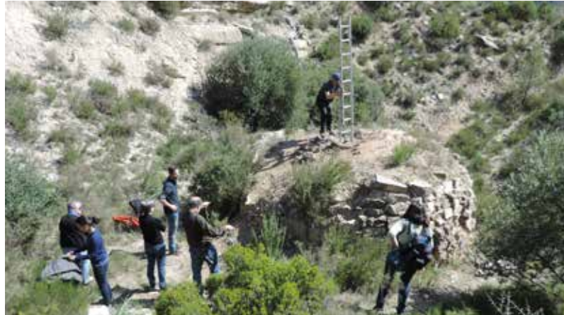
EL GRUP DE LA UNIVERSITAT DE BARCELONA VISITANT EL FORN QUE EXCAVARAN AQUEST ESTIU PER ESTUDIAR AQUESTES CONSTRUCCIONS.

'Els forns d'oli de ginebre. Una indústria a Riba-roja d'Ebre' és el títol de la mostra temporal que acollirà el Museu Etnològic i de Cultures del Món, entre l'11 de juliol i el 13 d'octubre, per donar a conèixer a la capital catalana el ric patrimoni riba-rojà al voltant dels forns d'oli de ginebre. L'espai museístic del carrer Montcada, situat davant del Museu Picasso, exposarà el llegat d'aquestes construccions de pedra seca arreu del terme municipal i la feina de documentació que ha fet l'entitat Amics de Riba-roja amb el suport de l'Ajuntament.