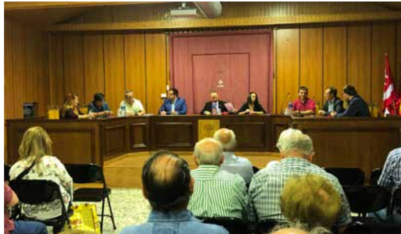
UN CENTENAR DE VEÏNS VAN ASSISTIR A LA SESSIÓ DE CONSTITUCIÓ DE LA NOVA CORPORACIÓ MUNICIPAL 2019-2023, EL 15 DE JUNY.

La "gestió econòmica responsable i prudent" comportarà continuar amb l'aposta per "la diversificació econòmica, la creació d'ocupació i la innovació", amb projectes com la consolidació de Zona Líquida i el