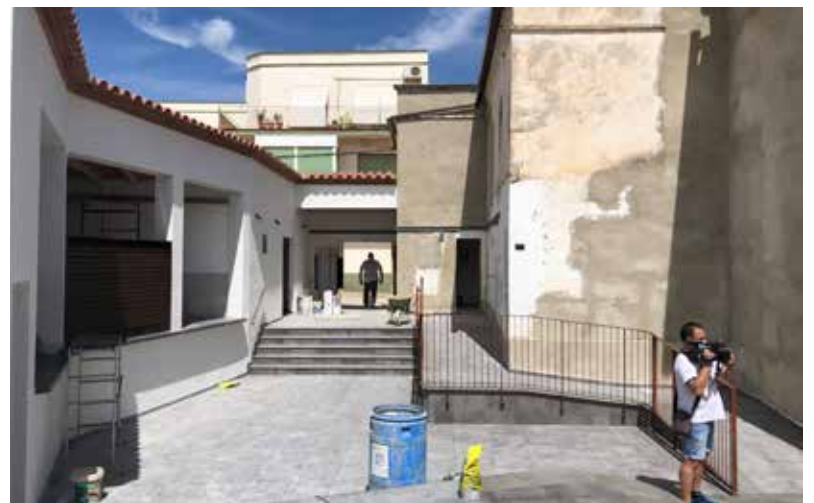
LA PLANTA BAIXA ES VA DEMOLIR PER REMODELAR TOTA LA PISTA.

La reforma de la pista de ball, que va passar a ser de titularitat municipal l'any 2013, s'ha dut a terme per adequar l'equipament a la normativa de seguretat de locals públics. S'han invertit uns 201.000 euros per remodelar un