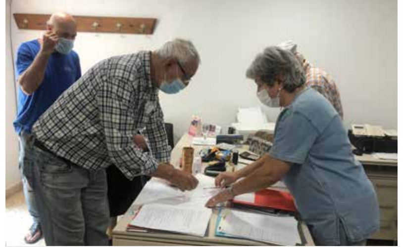
ELS VEÏNS QUE VULGUIN SIGNAR LA PETICIÓ PODEN FER-HO CADA DIA, DE 12 A 13 HORES, A L'OFICINA DE LA LLAR DELS JUBILATS.

Del mateix parer és el cap de l'oposició, José Luís Aparicio, que denuncia que els darrers anys s'han perdut més de mil professionals a la Sanitat i no es cobreixen les jubilacions: “És penós. La gent jove està acostumada a les tecnologies i ho viu diferent, però per a la gent gran aquesta situació és fatal: psicològicament necessiten un acompanyament i el contacte