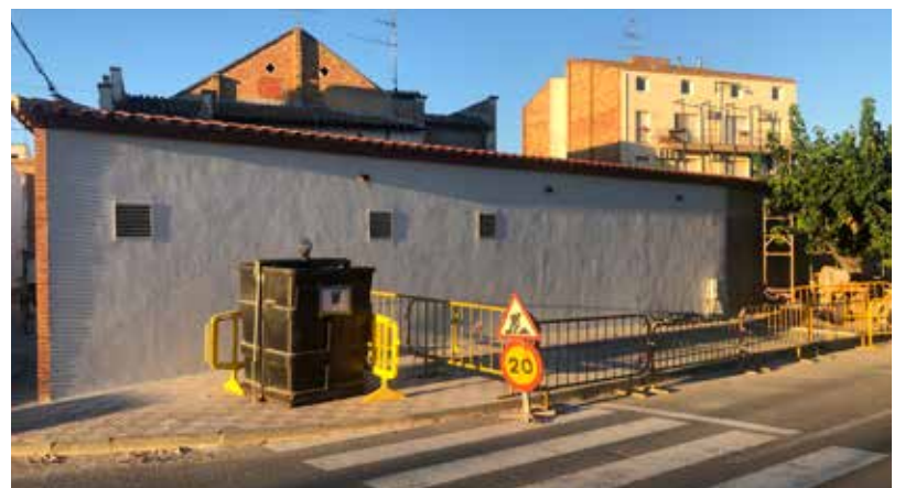
L'ILLA DE CONTENIDORS SOTERRATS AL C/ SANTA MADRONA, ELIMINADA.

que fa a la recollida d'orgànica, ha caigut de les 12,10 tones a les 4,15. El regidor de Medi Ambient, Lluís Busom, ho atribueix "al tancament de bars i restaurants, a la falta de veïns de segona residència i al fet que no s'hagi utilitzat dos punts negres de la recollida selectiva: l'illa d'emergència de l'escorxador i el punt de recollida ubicat a la zona de les barbacoas".