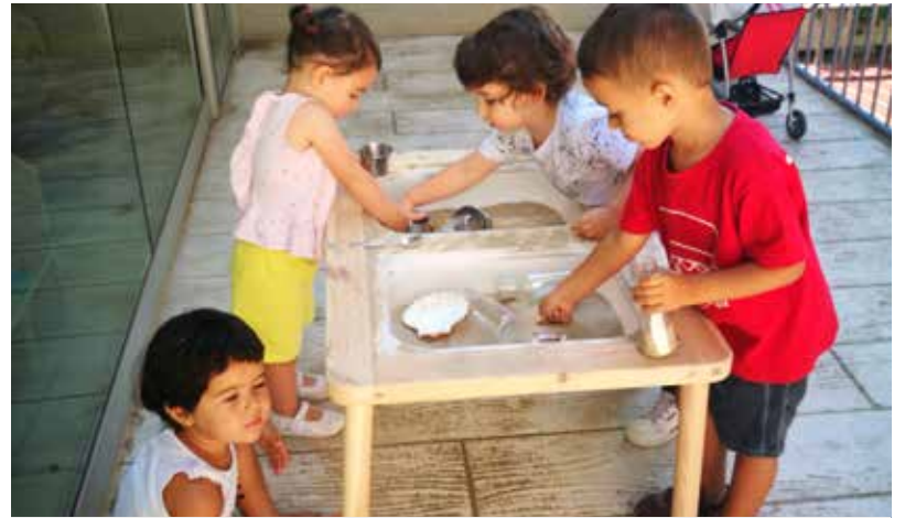
QUATRE INFANTS S'HAN REINCORPORAT A LA LLAR AL JULIOL.

Per compensar la suspensió temporal del servei, que no es va poder oferir al juny com l'escola perquè faltava enllestir l'adjudicació per Ple, l'Ajuntament ha ofert a les famílies afectades la possibilitat de tornar a escolaritzar els nens al juliol, últim mes d'aquest curs escolar. Així, quatre famílies s'han acollit a aquesta mesura, de les 10 places finalment disponibles. La llar s'ha adaptat a les mesures que requereix la pandèmia i funciona de 9 a 1, al matí, fins al 31 de juliol.