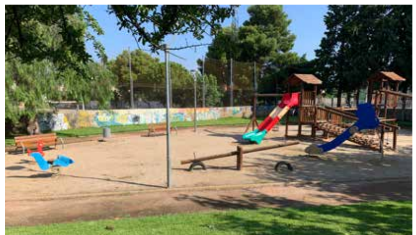
RENOVACIÓ ALS PARCS INFANTILS L'Ajuntament ha col·locat uns gronxadors a la zona infantil del carrer Lleida, a l'entrada del poble, i ha retirat el vaixell i una caseta en mal estat del parc de Mercè Rodoreda, on hi ha instal·lat un tobogan i, a petició d'alguns pares, dos nous bancs i una paperera.