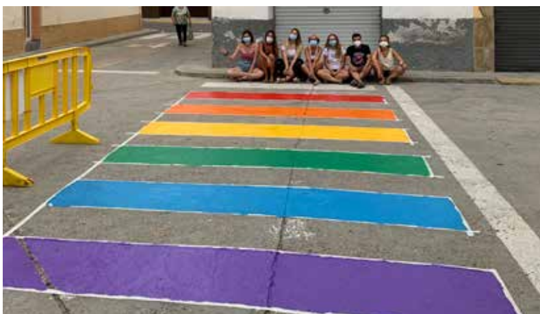
SUPORT AL COL·LECTIU LGBTIQ+ La regidoria d'Igualtat i els joves de la Txavalada han pintat un pas de vianants i un banc amb els colors de l'arc de Sant Martí, a la plaça dels Jubilats, per acabar amb els prejudicis i donar visibilitat a la lluita pels drets i la llibertat del col·lectiu LGBTIQ+.