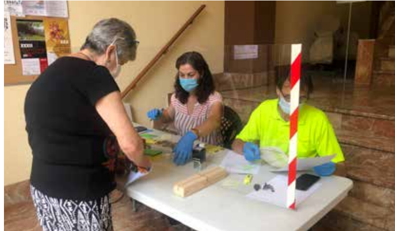
TREBALLADORS MUNICIPALS, ATENENT ELS CIUTADANS AMB MESURES.

La digitalització suposa canvis en la gestió i tramitació dels expedients, incrementant la càrrega de treball, amb procediments més complexos i un circuit de signatures que garanteix el compliment de la llei. Tot plegat, és un canal més àgil, segur i eficient. I ha permès a l'Ajuntament continuar funcionant