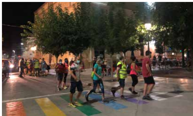
SORTIDA DE LA CAMINADA DE LA LLUNA PLENA, AMB MASCARETA I EN PETITS GRUPS PER LA COVID19.

Va ser precisament la cita de la Lluna Plena la que va iniciar l'activitat d'un grup d'aficionats al senderisme que l'any 2018 es van constituir com a entitat local. Organitzats a través d'un grup de whatsapp força actiu, amb 104 participants, també estan a facebook i a instagram, on mostren la seva filosofia, que