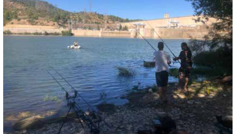
EL PANTÀ ESTÀ SITUAT ENTRE CATALUNYA I ARAGÓ. LA RIBA CATALANA (ZPC EBRE 01, SON 30) QUILÒMETRES ENTRE LA GRANJA D'ESCARP I FLIX.