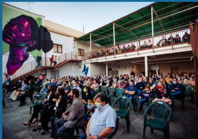
DUES ESCALES LATERALS PERMETEN ACCEDIR AL PRIMER PIS.

Segons Suárez, la reforma ahir estrenada ha estat "una obra complexa" i ha volgut "no perdre l'esperit d'aquella pista que ha