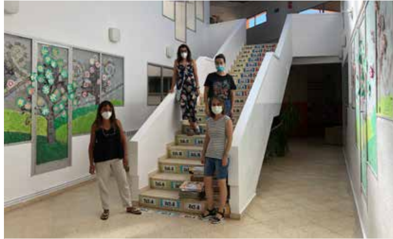
LES MESTRES DE L'ESCOLA, AL VESTÍBUL RECENT PINTAT, PREPARADES PER REBRE L'ALUMNAT DESPRÉS DE SIS MESOS SENSE CLASSES.

La principal novetat és la creació de quatre grups estables que estaran separats i no compartiran espais a l'escola, tampoc al pati ni en les entrades i sortides al centre. S'ha habilitat una ala de l'edifici per a cada grup: Infantil (P3-P5), cicle inicial de Primària (1r i 2n), Mitjà (3r i 4t) i Superior (5è i 6è). També s'han determinat les eines digitals que mestres, alumnes i famílies utilitzaran en cas de nou confinament i es dedicarà una franja horària per practicar-les a classe. El control de la temperatura a l'entrada, l'ús de mascareta per als majors de sis anys, la higiene de mans i la desinfecció d'espais i materials són